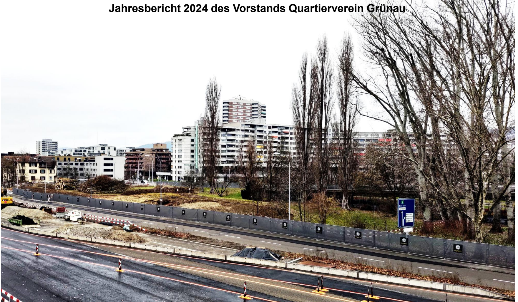
Februar 2025, Blick der Europabrücke auf die Grünau