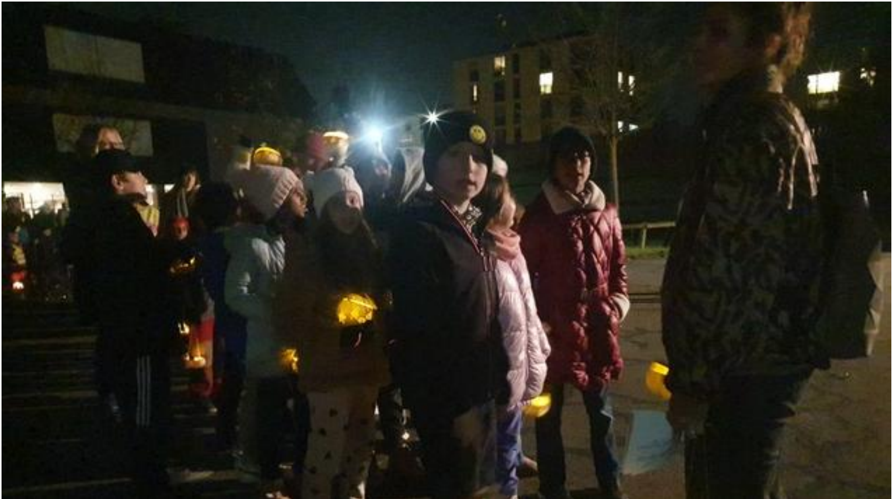
1. November 2024 Räbeliechtliumzug